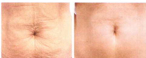
Przed zabiegiem i 6 miesięcy po zabiegu Thermage