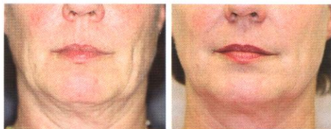
Przed zabiegiem i 2 miesiące po zabiegu Thermage

Zabiegi Thermage mogą być stosowane zarówno na twarz, jak i na ciało – zwłaszcza w takich miejscach jak brzuch, uda, pośladki, ramiona. Efektem zabiegu jest widoczne wygładzenie i ujędrnienie pomarszczonej i wiotczącej z czasem skóry na ciele.